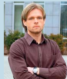
red. Marcin Matus

Oto drugie wydanie „Auto Świat Extra. Testy długodystansowe”, w którym prezentujemy kolejne 23 samochody. Każdy z nich poddaliśmy morderczej próbie na dystansie 100 tys. km, następnie rozłożyliśmy na części i dokładnie zbadaliśmy pod okiem fachowców. Wszystko po to, aby jak najdokładniej określić jakość, trwałość i koszty codziennej eksploatacji tych aut. Wyniki są bardzo ciekawe. Zachęcam do zapoznania się z nimi, tym bardziej że łamią pewne stereotypy.