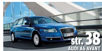
str. 38 AUDI A6 AVANT