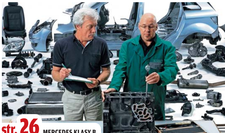
str. 26 MERCEDES KLASY B