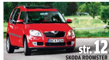
str. 12 SKODA ROOMSTER

OPEL ASTRA III 1.9 CDTI ORAZ VW GOLF V 1.4 NA DYSTANSIE 200 TYS. KM